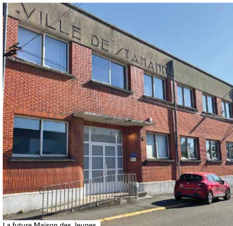
La future Maison des Jeunes