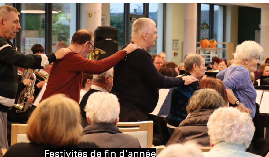
Festivités de fin d'année