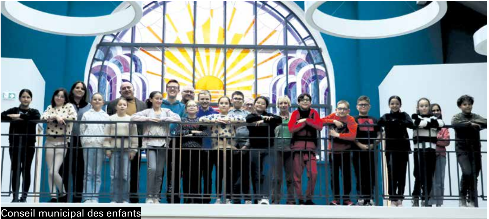
Conseil municipal des enfants