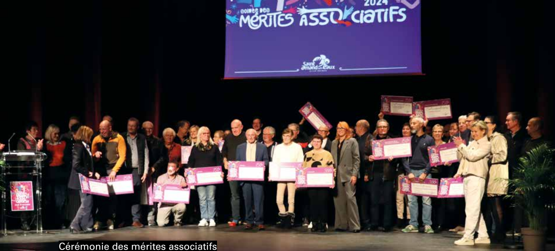
Cérémonie des mérites associatifs