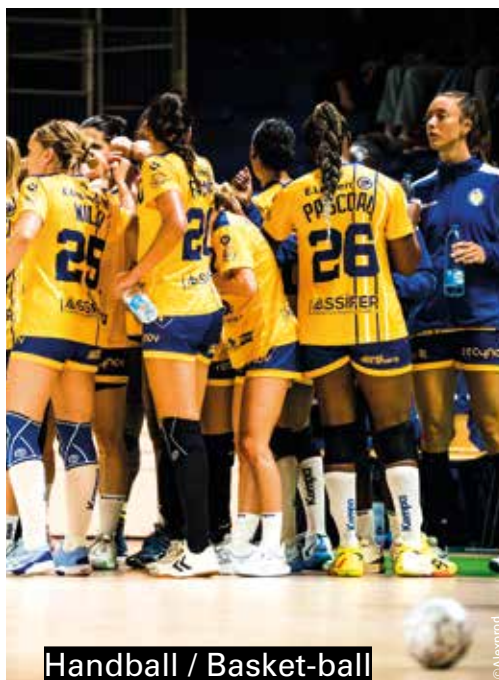
Handball / Basket-ball

Tour à tour les colombophiles sont mis en avant mais c'est avant tout son ou ses pigeons qui sont les vrais performeurs des différentes compétitions. Entre coupes et diplômes, les colombophiles de la société de Saint-Amand ont été nombreux à recevoir une voire des récompenses. La remise de prix s'est terminée par la présentation officielle du nouveau bureau pour l'année à venir. Cette grande famille compte actuellement 22 membres joueurs.