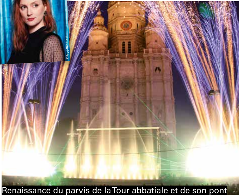
Renaissance du parvis de la Tour abbatiale et de son pont