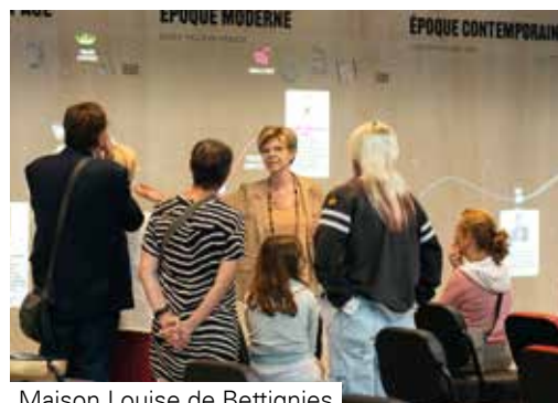
Maison Louise de Bettignies