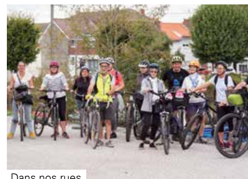
Dans nos rues