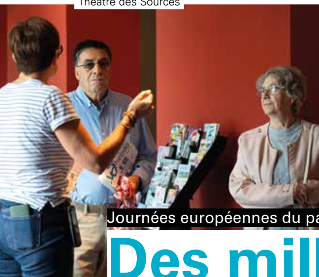
Journées européennes du patrimoine