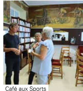
Café aux Sports