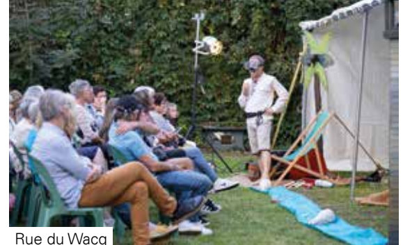
Rue du Wacq