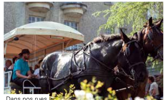
Dans nos rues