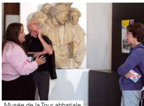
Musée de la Tour abbatiale