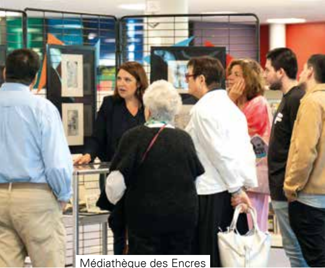
Médiathèque des Encres Théâtre des Sources