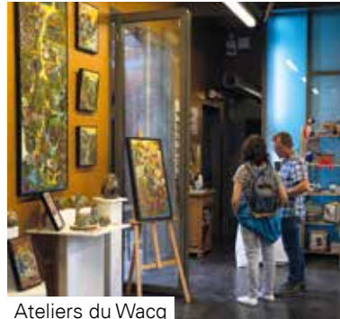
Ateliers du Wacq