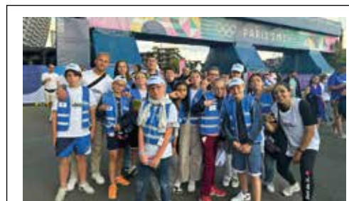
Des enfants et des adolescents des accueils de loisirs et du CAJ (Centre Accueil Jeunesse) ont eu l'opportunité d'assister à des épreuves olympiques de basket-ball le 27 juillet. Un moment inoubliable !

20 enfants accueillis, en moyenne, lors de chacun des six mini-séjours à Merlimont