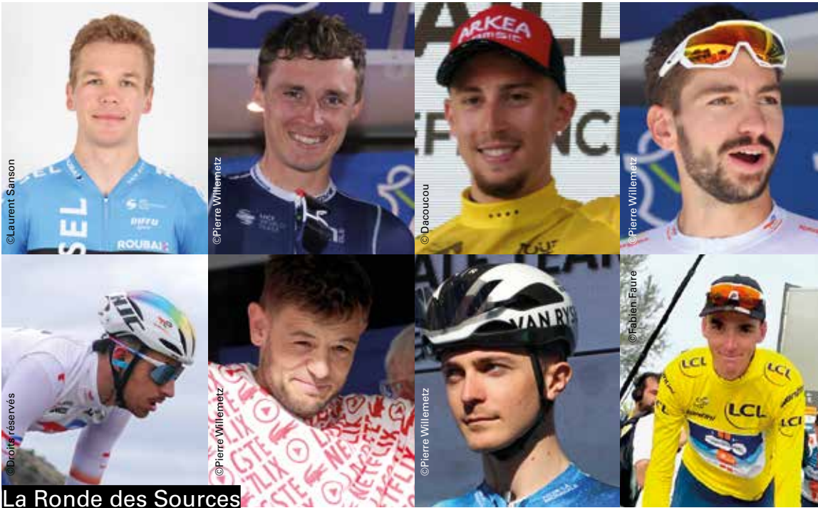
La Ronde des Sources