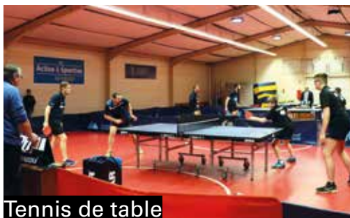
Tennis de table