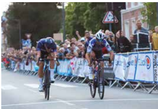
Julian Alaphilippe et Valentin Madouas franchissant l'arrivée

« On a eu un vrai finish », pointait le député Fabien Roussel lors de la remise des prix. Laurent Pichon l'a emporté en termes de point et Julian Alaphilippe au chronomètre. « C'était un beau plateau, une belle course devant un public incroyable qui nous a encouragés, s'est réjoui le champion. On a vraiment appréciés, nous les coureurs. » « On n'a pas toujours la possibilité de prendre le temps avec le public. Là, on a pu, ajoutait Laurent Pichon. Merci parce que nous nous sommes régalés. »