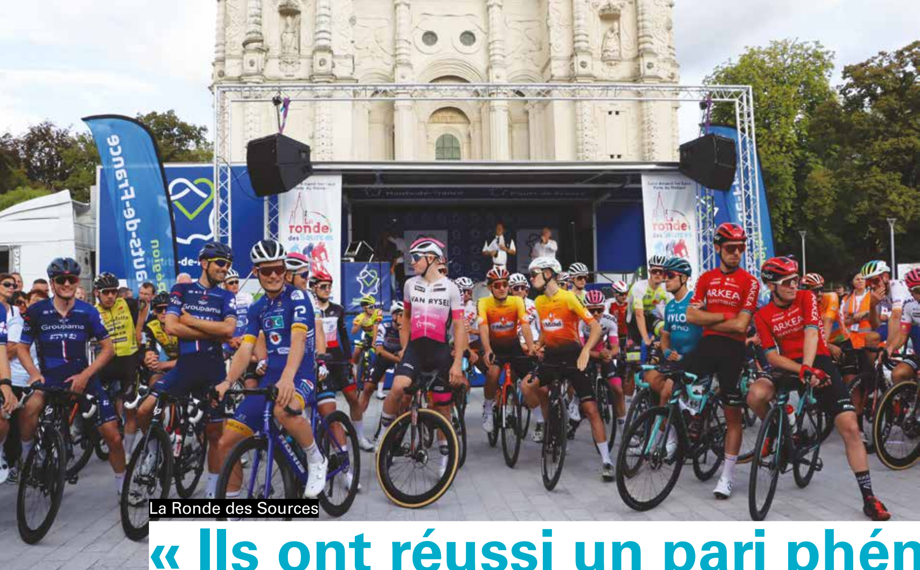
La Ronde des Sources