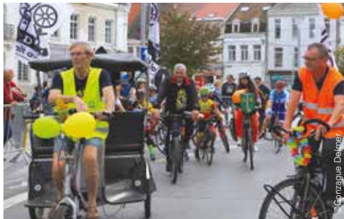
La balade cycliste festive, organisée par l'ADAV, a embarqué une soixantaine d'amateurs de vélos

Pour ce premier critérium cycliste professionnel, la météo a été généreuse, les coureurs ont été généreux et le public, venu en nombre, a lui aussi brillé de générosité.