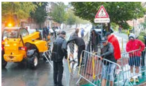
Plus de 160 bénévoles ont rendu le critérium possible. Le cyclo club, le VTT et l'Iron Team de Saint-Amand se sont particulièrement impliqués