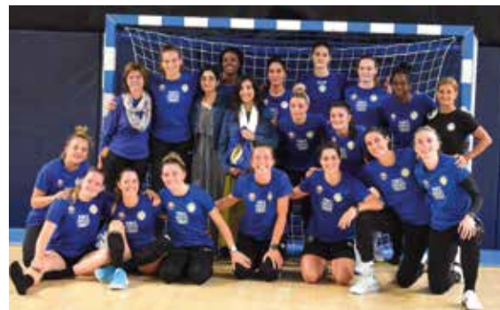
Rencontre entre les handballeuses afghanes et amandinoises.