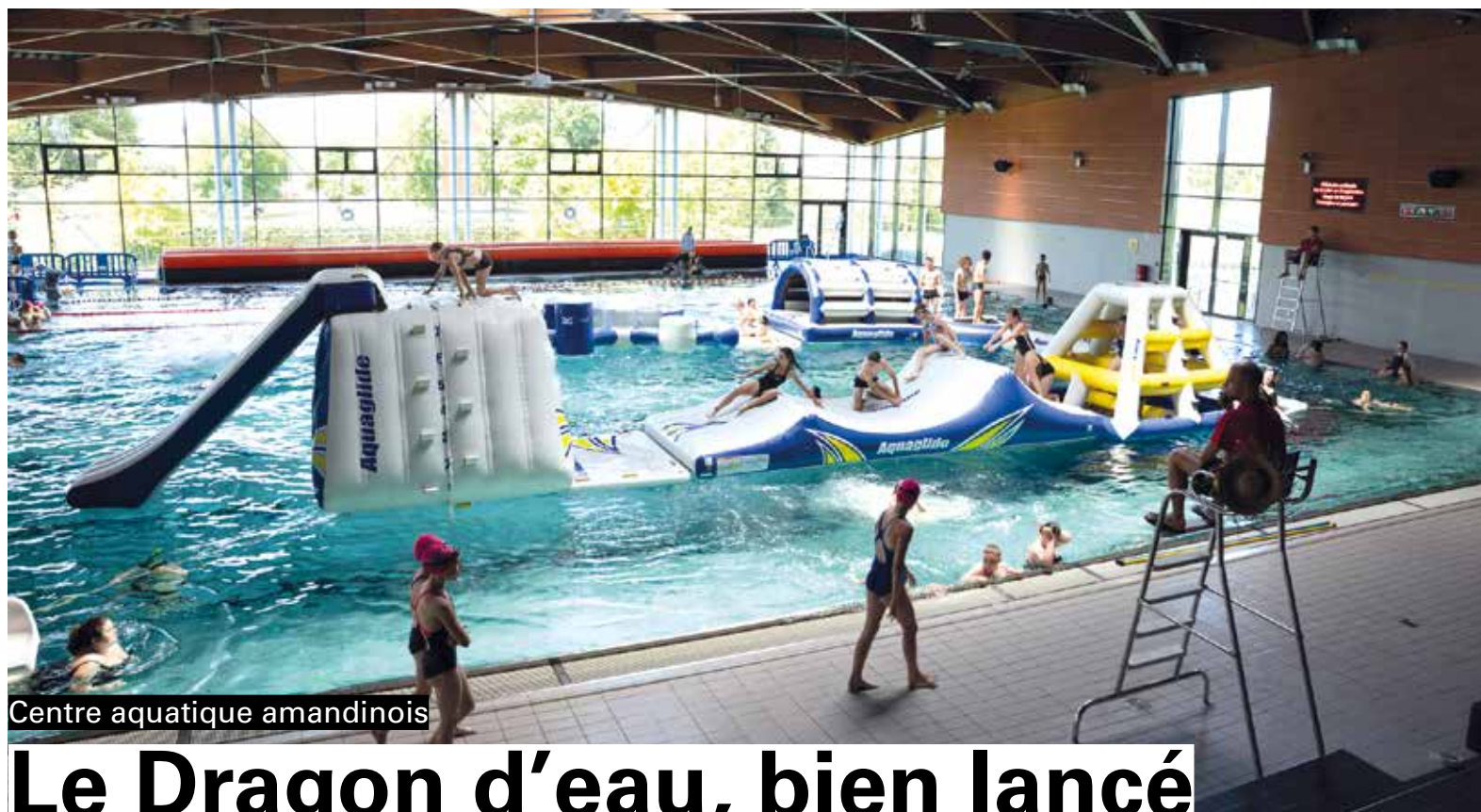
Centre aquatique amandinois