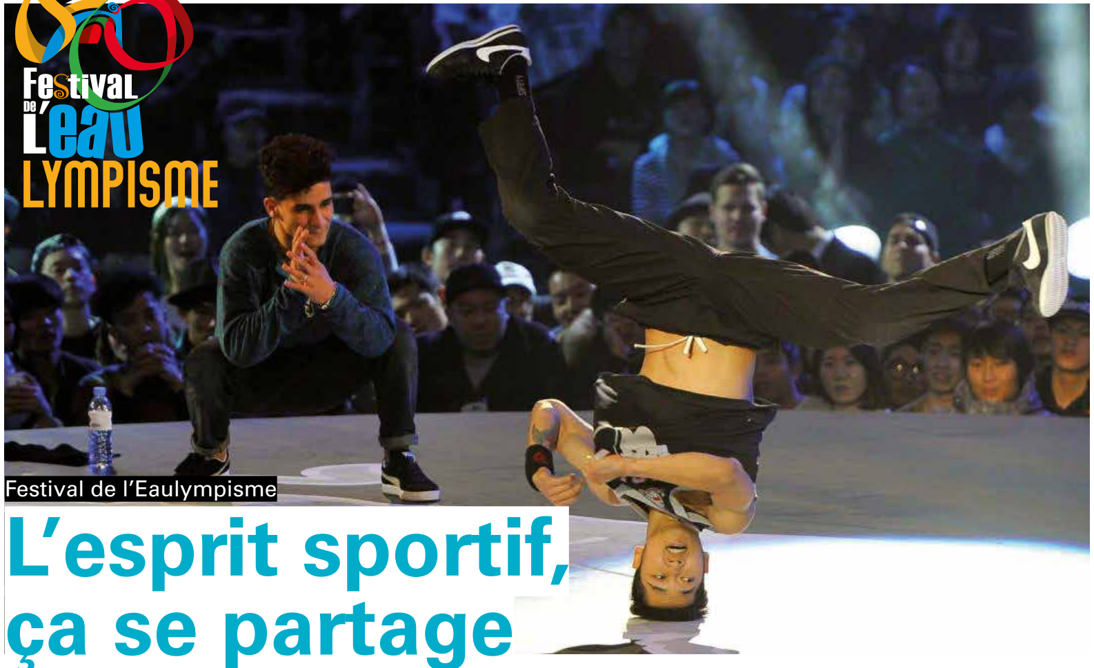
Festival de l'Eaulympisme