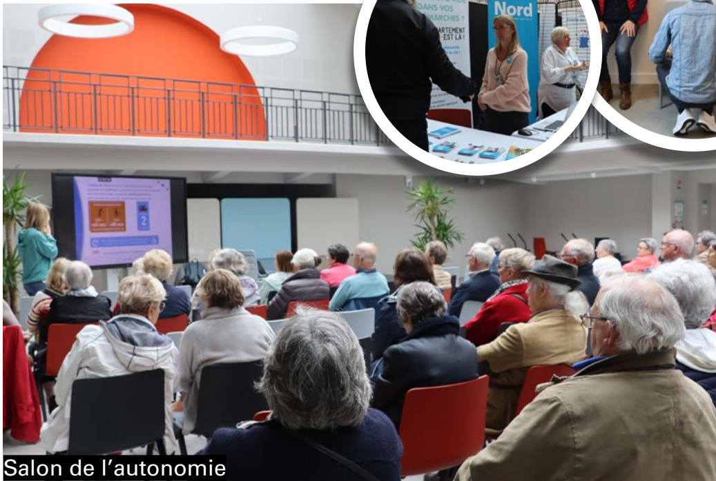
Salon de l'autonomie