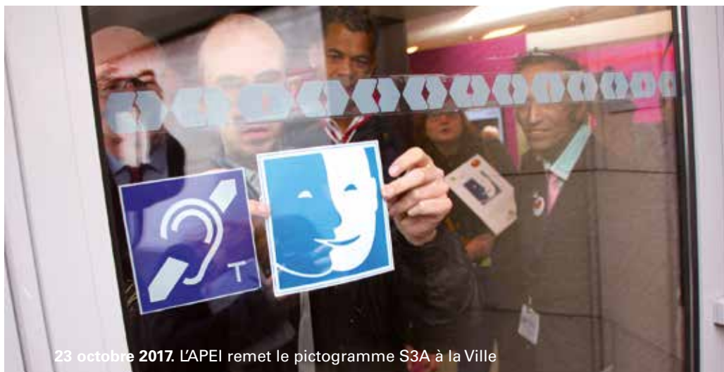
23 octobre 2017. L'APEI remet le pictogramme S3A à la Ville

« Ensemble, on va plus loin. » C'est sur cette idée que s'est fondée, le 5 janvier 1961, l'APEI du Valenciennois qui regroupe parents et amis de personnes en situation de handicap intellectuel. Aujourd'hui, l'association fait résolument partie des moteurs du territoire. Dans notre ville, elle investit, participe à la vie économique, culturelle, sportive et festive, fait naître des initiatives... Retour sur soixante ans d'actions.