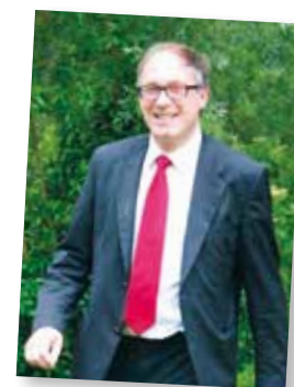
Pierre Wacquier Bourgmestre de Brunehaut