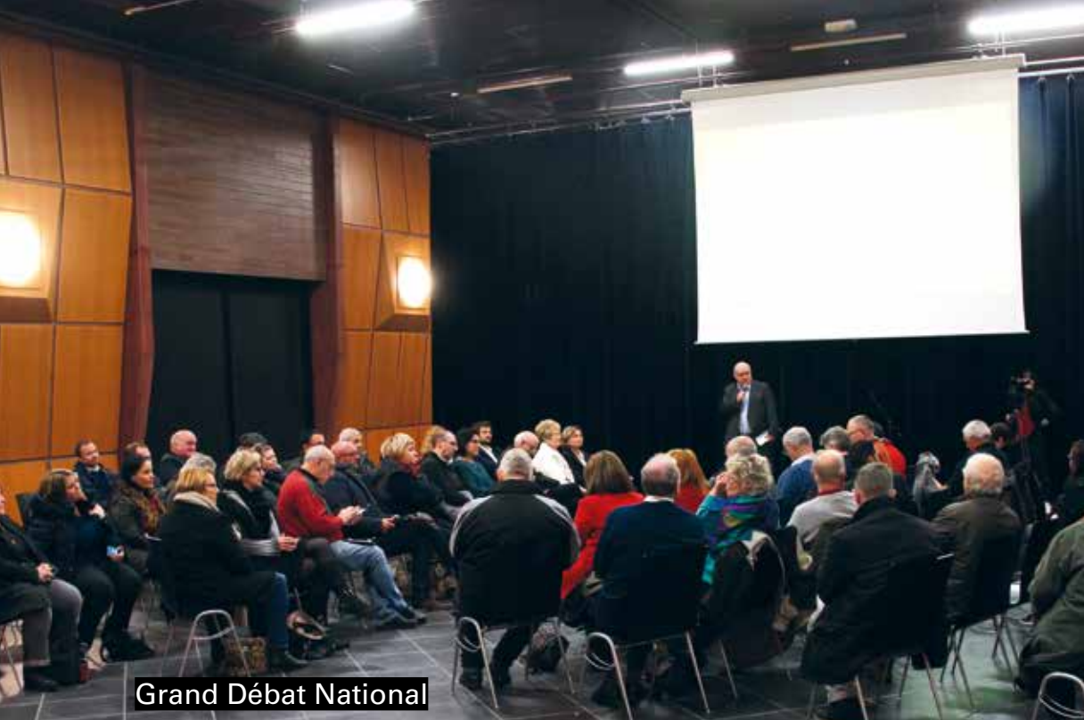
Grand Débat National